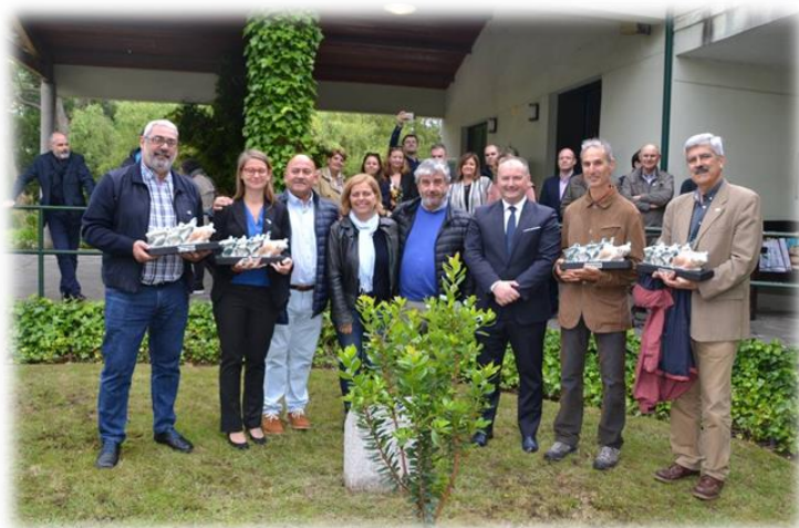
Programa de Educación Ambiental “Educando na Biosfera”. Curso Académico 2018/ 2019

A colaboración e o establecemento de alianzas con outras entidades ten sido clave para avanzar na consecución das liñas de acción da Reserva de Biosfera, colaborando con outras entidades como a Fundación Juana de Vega, IGAPE, Consorcio As Mariñas, Grupos de Acción Costeira “Golfo Ártabro Norte” e “Golfo Ártabro Sur”, Fundación Fragas do Mandeo, Grupo Naturalista Hábitat ou a Asociación de Viticultores da Indicación Xeográfica Protexida “Viño da Terra de Betanzos”, entre outras.